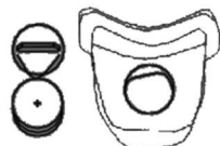
2. Pred prvým použitím vytiahnite plastovú pásku spod batérií.