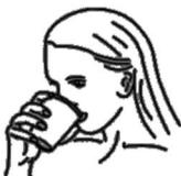
6. Vypláchnite ústa a umyte náustok