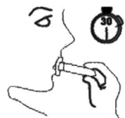
5. Nechajte pôsobiť so zapnutým svetlom 30 minút.